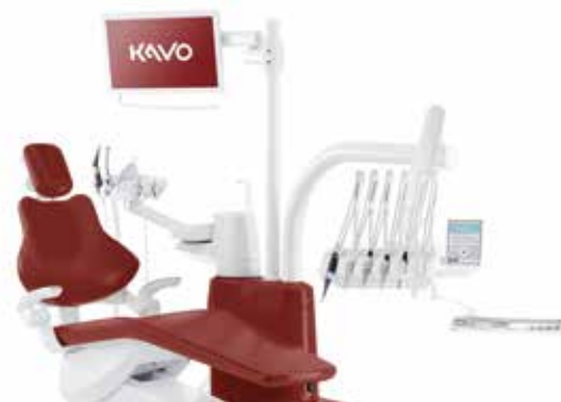
ESTETICA E50 Life

Votre prochaine unité de traitement vous correspond. Le KaVo ESTETICA™ E50 Life offre un maximum d'espace pour une position de travail bonne pour la santé, que vous soyez assis ou debout. Grâce à la grande amplitude de déplacement du fauteuil et à la forte stabilité de l'élément praticien, rien ne viendra perturber le traitement.